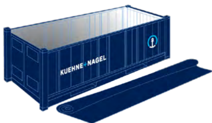
Open Top 20' (OT)