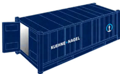
Standard 20' (Dry Container - DC)